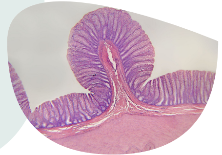
Darmzotten: Sie sorgen für die Resorption der Nahrung.

Bei vielen Menschen funktioniert die Verdauung jedoch nicht so selbstverständlich, wie es die Natur vorgesehen hat: Jeder Dritte in Deutschland leidet unter anhaltenden Magen-Darm-Beschwerden wie Blähungen, Verstopfung, chronischen Durchfällen, entzündlichen Darmerkrankungen (z.B. Morbus Crohn oder Colitis ulcerosa) bis hin zu Darmkrebs. Eine einfache Stuhluntersuchung kann zur Ursachenfindung der Probleme beitragen: der Gesundheitscheck Darm.